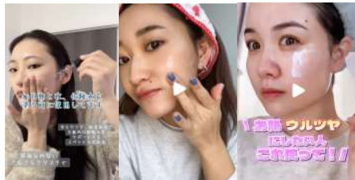
商品を使用している様子