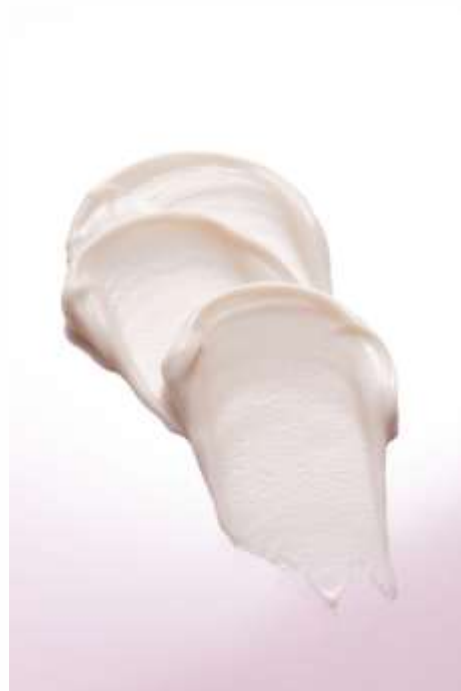
セラムの粘度の紹介と使用している様子