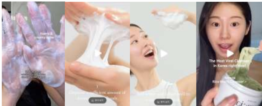
製品のテクスチャーの紹介

「スキンケア紹介」 「テクスチャー撮影」 などで検索すると 参考になる動画 を見ることができます。